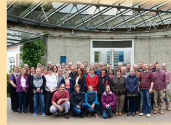
Mitarbeiter des Zentrums