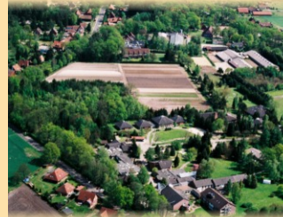
Gelände des Freizeit- und Tagungszentrums